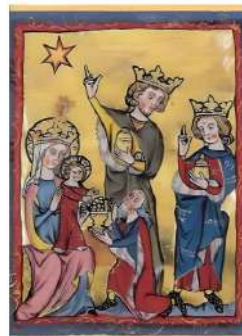
«Adorazione dei Magi» - Miniatura del Codice di Engelberg, 1130

Il Giubileo è stato in diocesi una variegatissima occasione di scoperte delle tante "stelle" che ci precedono e ci guidano sul territorio diocesano. Abbiamo provato, come i magi, gioie grandissime. Ma anche percepito indicazioni verso strade nuove. Come i magi, abbiamo aperto i nostri scrigni e ci sono state svelate le nostre tante ricchezze: oro di disponibilità, incenso di spiritualità e mirra di carità. Ci siamo anche confrontati con la povertà dei nostri mezzi e il calo della partecipazione. Eppure, con gli occhi della fede, abbiamo visto, anche in mezzo alla precarietà, il bambino con sua madre. [...] E noi, come magi del nostro tempo, non torniamo più come eravamo prima: altre strade diventano possibili anche per noi. Ripartiamo da Cristo, insieme!